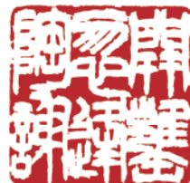
倍率1.8倍だから、 こう見える(イメージ)

自由に屈折できる長さ39cmのアームも特長の一つ。両手の自由さが篆刻の“大胆奏刀”をきっと生み出します。